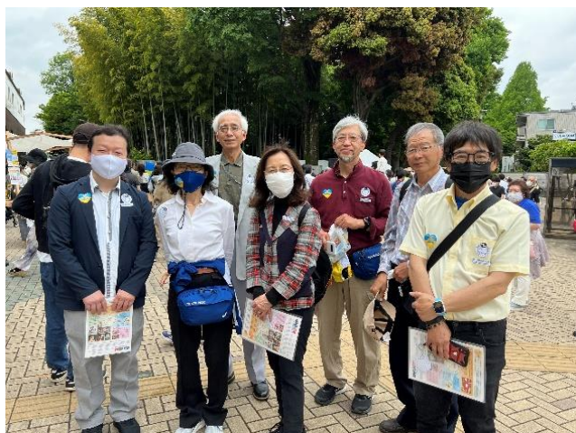
(ウクライナイベント参加時の様子)

KIFAとしても、平和な国際社会・国際親善に向けた社会貢献を考えていきたいと思っています。何かアイデアなどをお持ちの方は、気軽にお声掛けいただければありがたく思います。