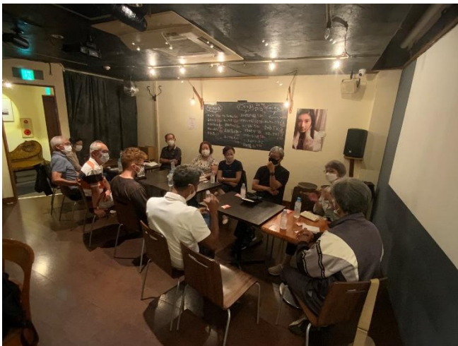
(前回 6 月 4 日のこまぐりっしゅ café)

参加費：会員 500 円、一般 1,000 円 ご都合のつく方は、是非ご参加ください。