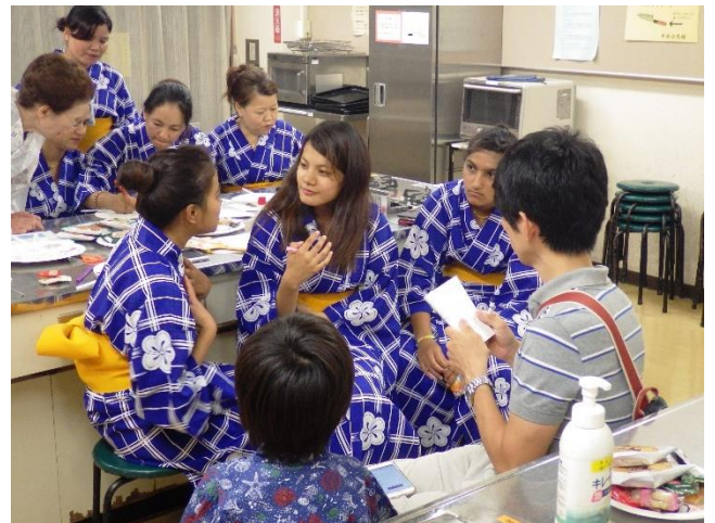
(控室となった中央公民館の一室にて)

昨年までとは違った取り組みでしたが、関係された方の協力もあり、無事に催しを終えることができました。