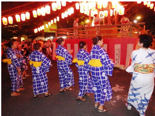
(市民ひろばでの踊り)

今回、ネパール、ベトナム、フィリピンの方々などアジアの方々が中心でしたが、こちらで準備した団扇(うちわ)へのお絵かきや茶菓子を楽しんでいただくひと時もありました。