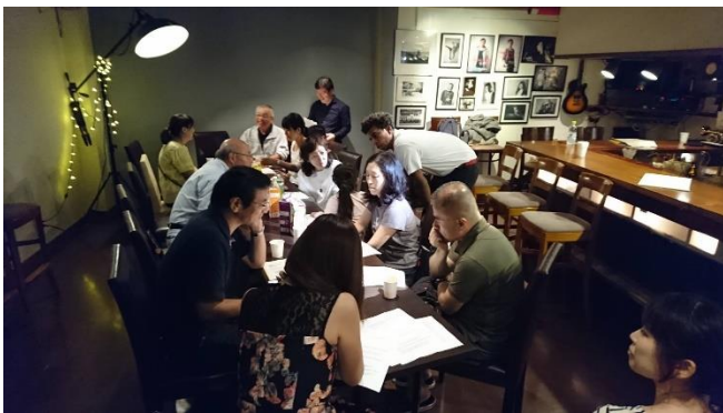
（参加者で賑わう第二回目の様子）

第一回目（9月3日）、第二回目（10月1日）共に盛況で、多くの方々に生の英語に触れる機会を持っていただきました。KIFA への入会者も増えました。