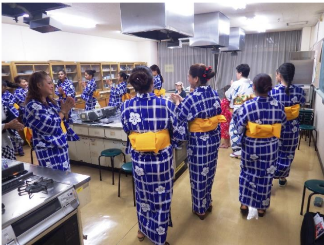
(先生からの手ほどき)

8月6日(土)、いずみ会主催の納涼盆踊り大会に17名の外国人の方々と一緒に参加しました。外国人の方々には、事前に中央公民館に集まっていたいただき、浴衣の着付けをした後、盆踊りの先生から手ほどきをいただいて、市民ひろばでの本番に備えていただきました。