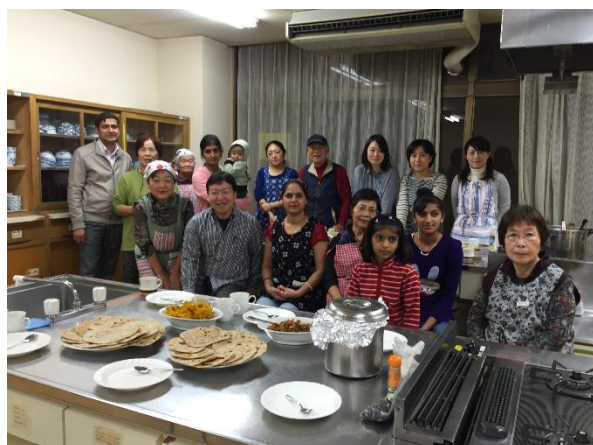
(前回の国際交流サロン「ネパール料理」)