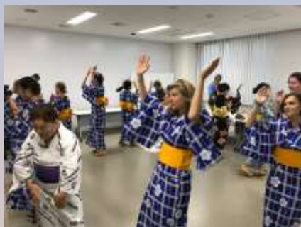
※画像は昨年のものです。